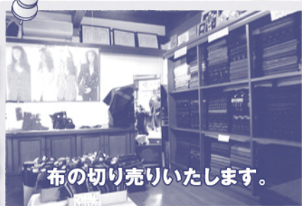
布の切り売りいたします。